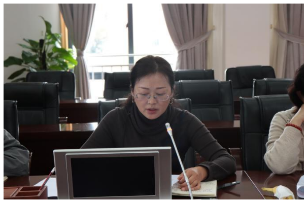
图 3 基础部作汇报