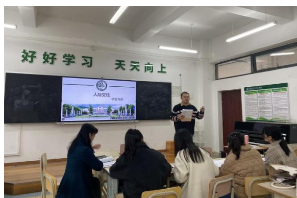
图 3 心理健康教研室开展教师试讲