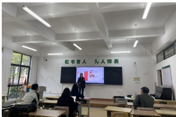
图 4 特殊教研室开展教师试讲