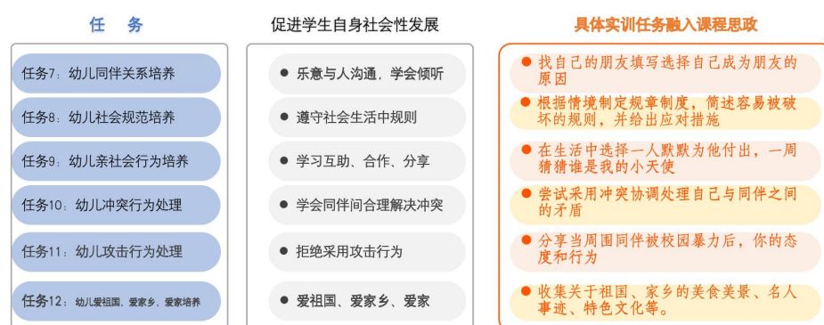
图 4：“育人育己”实训内容（节选）

本课程从内容上，在各模块及各个项目中，我们利用实训手册和学习通发布除专业知识、专业能力学习任务之外，还为提升学生的自我修养，教师素养，促进学生自身社会性发展提供专门思政教育的实训任务。