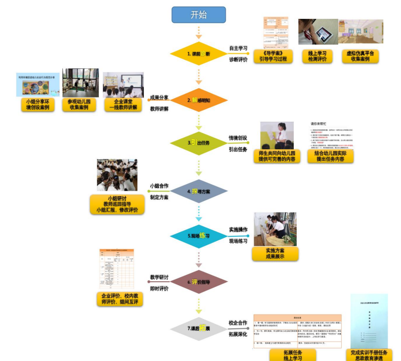
图 3：“项目：幼儿社会规范培养”实施过程

依据学情分析，精心设计任务，以任务为驱动，以项目为内容，根据三阶段七环节教学思路为主线完成任务。学生课前通过“导学案”，整体了解项目内容，具体学习路径，跟随主线进行学习和实训活动，促进学生注重学习的每一个环节，提高学生自主探究能力。