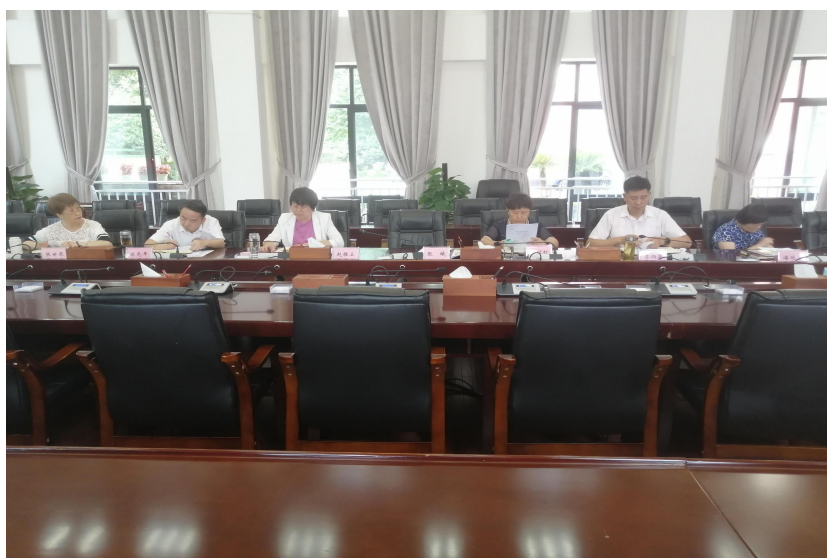
学校领导出席会议

为有序推进省级“双高”项目建设年度目标及各项任务，2021年7月22日上午9:00至11:30，各项目建设负责人及相关部门成员于峻德楼一楼会议室召开了省级“双高”项目建设推进会。出席会议的学校领导有：校长翟理红、党委副书记李炳昌、副校长赵雅卫、副校长潘丽芬、纪委书记陈尧年、副校长张世琴，党委副书记李炳昌主持会议。